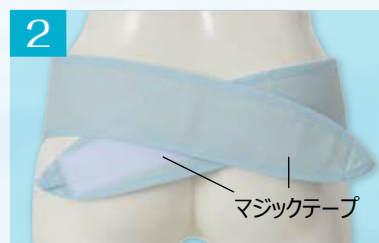
2 マジックテープで止めます。