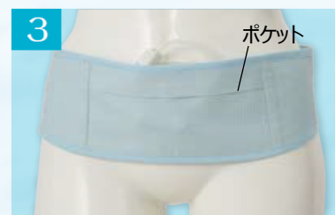
3 ポケットにチューブを入れます。