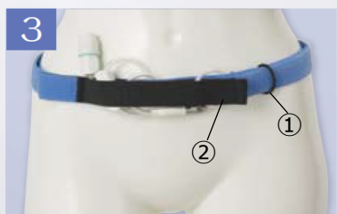
3 開いていた②の上側のシリコン部分を閉じ、固定します。