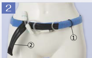
2 ②の上側のシリコン部分を開き、下側のシリコン部分にチューブを巻きます。