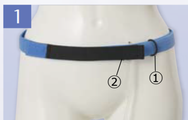
1 ①のリングを通し、お腹にフィットするように固定します。