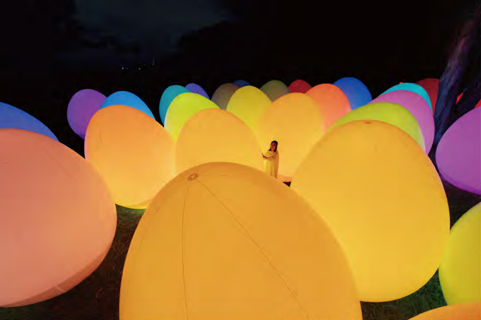
チームラボ《自立しつつも呼応する生命の森 - ユーカリ》©チームラボ