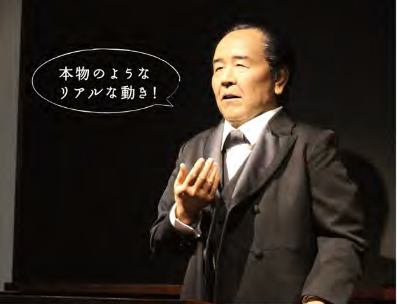
2階の講義室の渋沢栄一アンドロイド。講義終了後は一緒に記念撮影をすることができます