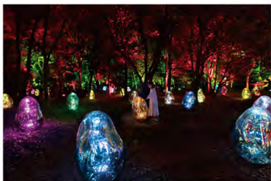
チームラボ(ツバキ園の呼応する小宇宙-固形化された光の色, Dusk to Dawn)©チームラボ