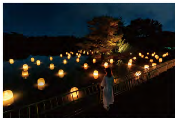
チームラボ《大池に浮遊する呼応するランプ》©チームラボ