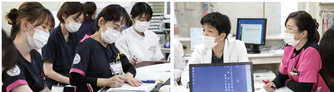
チーム医療を支える部署を超えた情報共有は患者さんのことだけでなく、お互いの部署の仕事が見えてきます