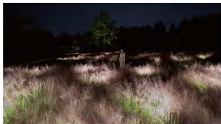
チームラボ《光色の草原 - カピラリス》©チームラボ