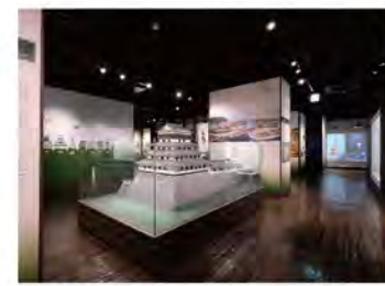
2階は歴代城主などの歴史に関する展示。歴史好きにはたまらない内容