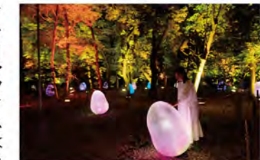
チームラボ《ツバキ園の呼吸する小宇宙 - 図形化された光の色, Dusk to Dawn》©チームラボ ※冬は防寒対策、夏場は虫よけスプレーが必須です。

クライマックスはラクウショウの並木道。人々が近くを通ると強く輝き、心安らぐ音色を響かせ、光は周辺のラクウショウの木へ伝播していきます。ゆっくり歩いて約1時間半。歩きやすい靴で来園を。