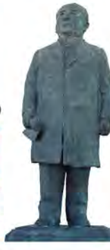
渋沢栄一記念館。ふるさとの野山をながめる渋沢栄一(銅像)