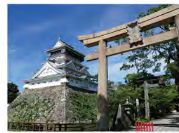
小倉城の天守閣の高さは全国6位