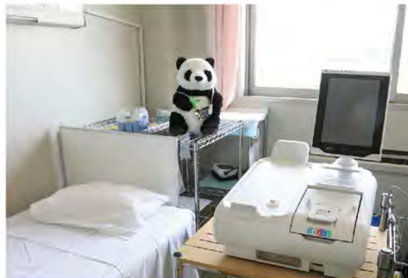
PDの手技指導は患者さんも訪問看護師も安心してできるまで何度も繰り返します

外来専門で集中して診れるようになったんです。これをきっかけに、病棟・外来それぞれで受け皿に余裕ができて部署間で働き掛けができるようになって、ぐんとPD患者さんが増えましたね。