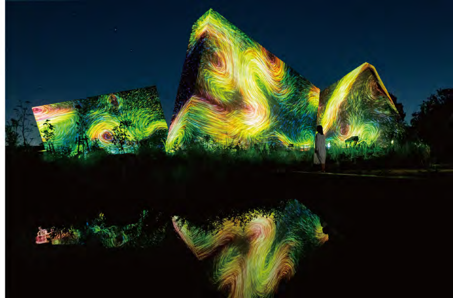
チームラボ《風の中の散逸する鳥の彫刻群》©チームラボ