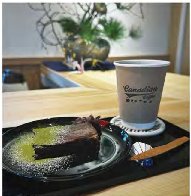
天守閣5階のキャッスルカフェ。お店は順次変わります