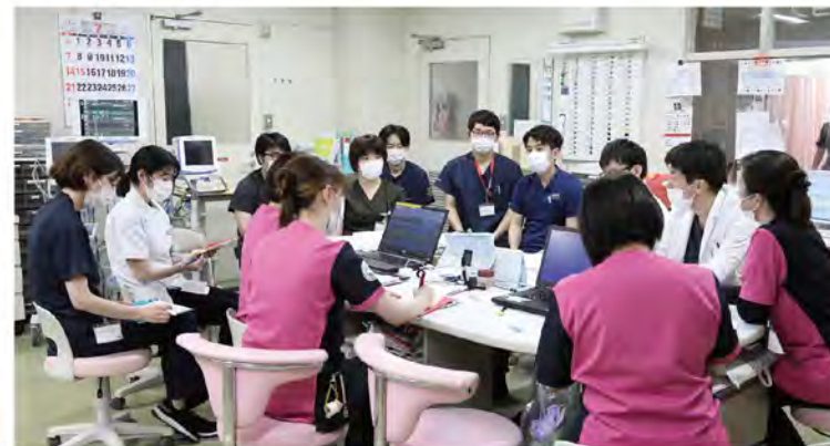
チームが一堂に会するカンファレンス