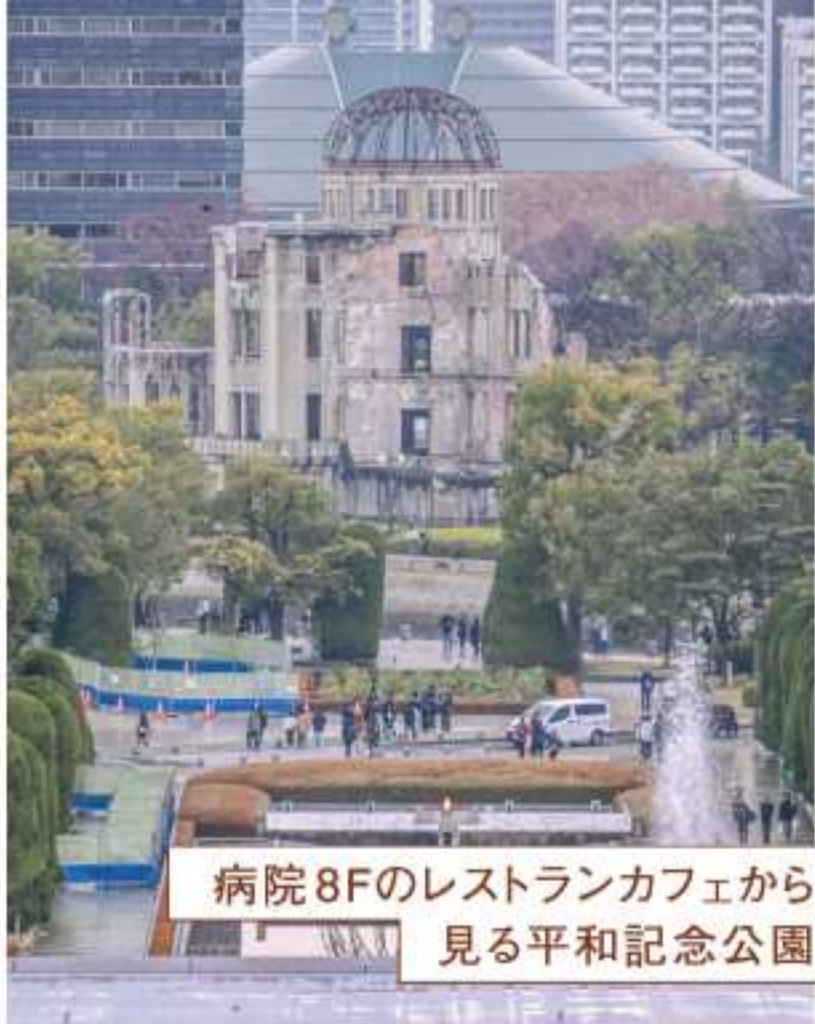
病院8Fのレストランカフェから 見る平和記念公園

ステーションを展開し、地域における医療・介護連携の充実を進めながら、より多くの患者さんを診療できる体制づくりを進めています。