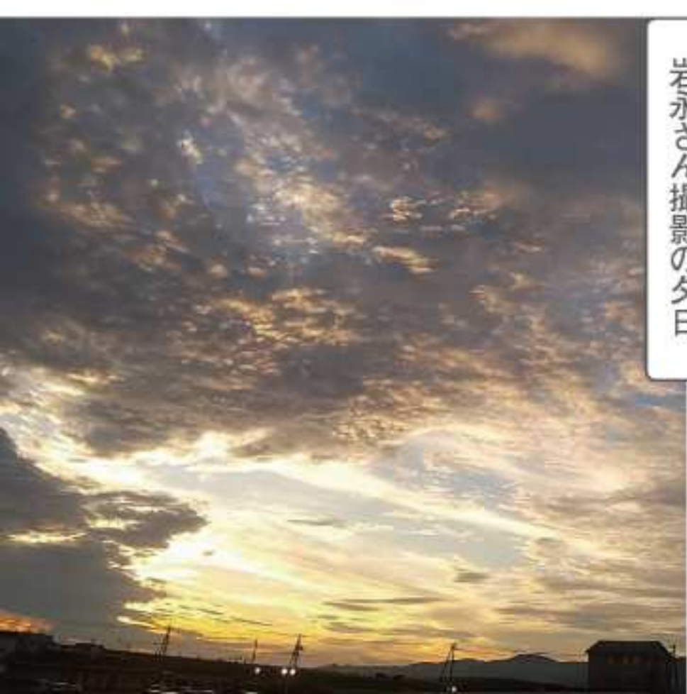
岩永さん撮影の夕日

「PD患者さんへのメッセージ」 腹膜透析液は毎日ご自宅や勤務先で使われて、日常のひとつになっただけで、日常のひとつにその日常が日常であり続けるために、安全で有効な腹膜透析液をお届けする責任を感じます。一つひとつの検査と判断が、治療を続ける患者さんにつながっている、その想いで品質管理を続けてまいります。