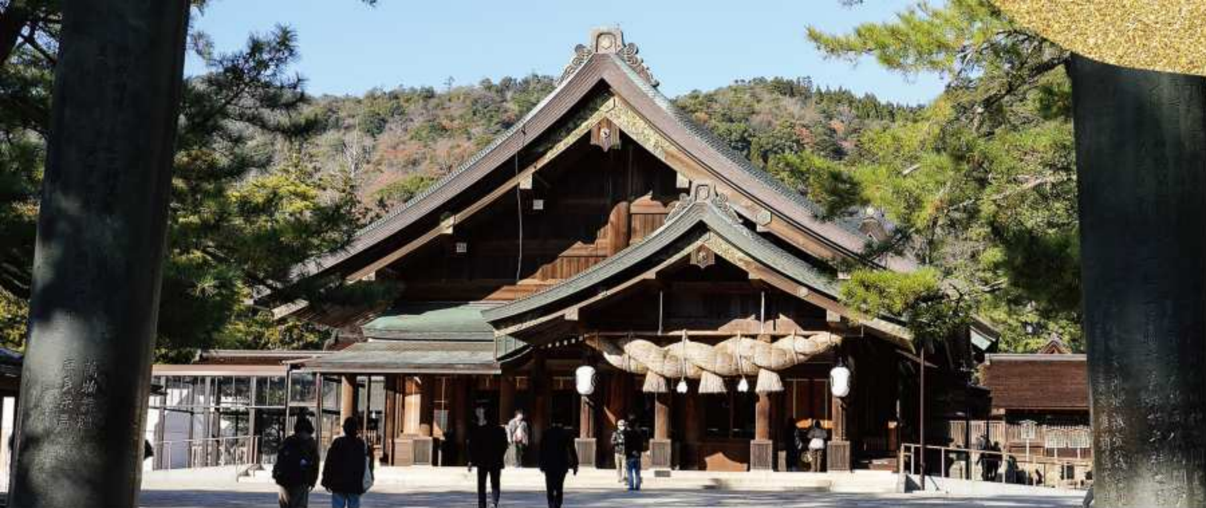
出雲大社 拝殿。参拝者の祈禱や、お祭りなど様々な奉納行事が執り行われます。