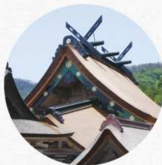
国宝・出雲大社御本殿

平成12年、この地から巨大な柱が出土しました。古代本殿が高さ48メートルに及んだという伝承を裏付ける発見です。赤い円が、その柱の出土跡地を示しています。かつてこの高さからは、どのような景色が広がっていたのでしょうか。